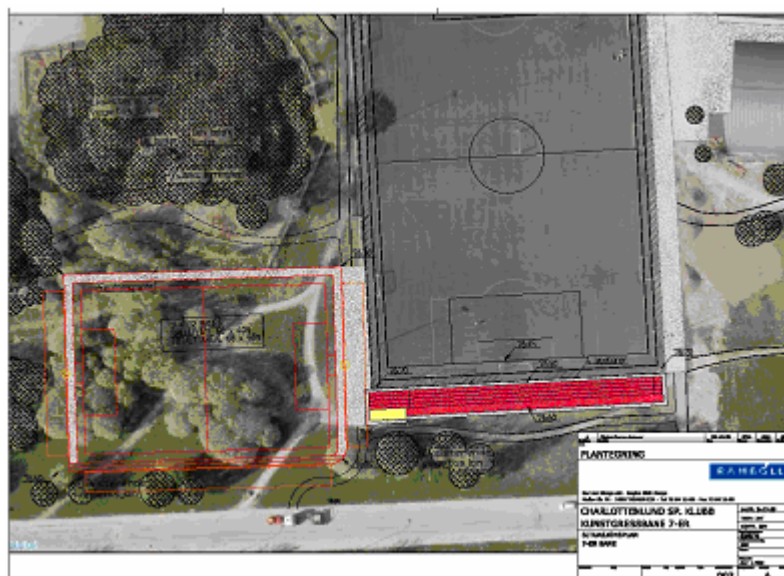
Hovedstyret Charlottenlund sportsklubb og Charlottenlund Idrettspark

Som de fleste sikkert har sett, har vi nå startet bygging av ny 7-er kunstgressbane sammen med ny flott 60 meters løpebane og lengdegrop. Anlegget vil gi fotball avdelingen en kjærkommen økt banekapasitet og mulighet for mer allsidig trening for alle i klubben. Ikke minst for elver ved skolen.